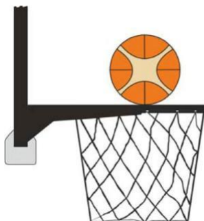
Dijagram 2. Lopta dodiruje obruč

31-15 Iskaz. U toku šuta na koš iz igre, igrač odbrane ili napada je načinio prekršaj ometanja kada dodirne koš ili tablu dok je lopta u dodiru sa obručem i još ima šansu da uđe u koš.