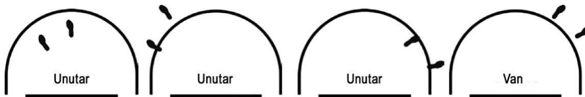
Dijagram 4. Položaj igrača unutar/van polja polukruga bez probijanja

Tumačenje: Ovo je pravilna igra igrača A1. Primjenjuje se pravilo o polukrugu bez probijanja.