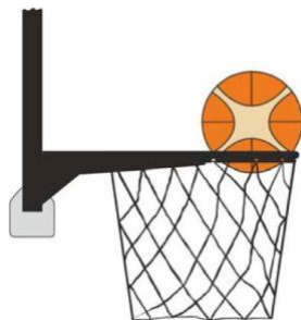
Dijagram 3. Lopta je unutar koša

31-20 Iskaz. Prekršaj ometanja nastaje ako igrač odbrane dodirne loptu dok je ona unutar koša.